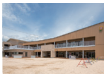
ひまわり さかえこども園 約230m (徒歩3分)