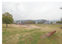
さかえ公園 約300m (徒歩4分)