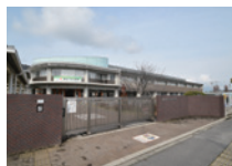
大竹市立大竹小学校 約1400m (徒歩20分)