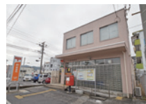
大竹栄町郵便局 約550m (徒歩7分)