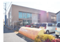
バウムクーヘン歯科クリニック 約350m (徒歩5分)