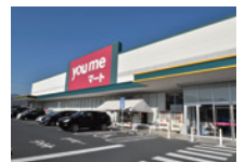
ゆめマート 西栄店 約220m (徒歩3分)

(大竹市西栄分譲地物件概要) ●取引態様: 売主 ●土地の権利形態: 所有権 ●所在地: 広島県大竹市西栄3丁目 ●交通: JR山陽本線「大竹駅」徒歩4分 ●総開発面積: 1400.13㎡ ●総区画数 8区画 ●販売区画数: 8区画 ●建築条件: 付 ●前面道路: 北東8m/北西7m/南東6m幅アスファルト舗装 ●私道負担: 無 ●建ぺい率: 60%、容積率: 200% ●設備: 水道公共下水 ●用途地域: 第一種住居地域 ●地目: 宅地 ●造成完了時期: 2024年1月 ●更新日: 2024年7月 ●次回更新予定日: 2024年10月 ●取引条件の有効期限: 2024年10月